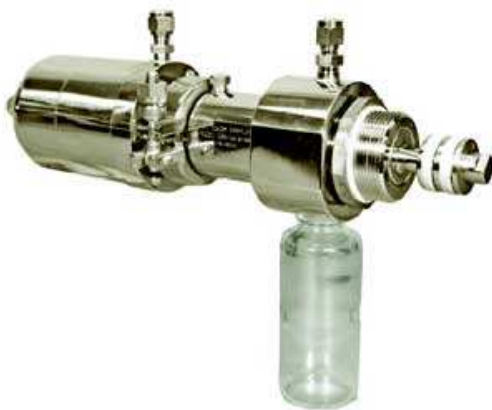
Ref: M4KSA (1cc - 3cc)