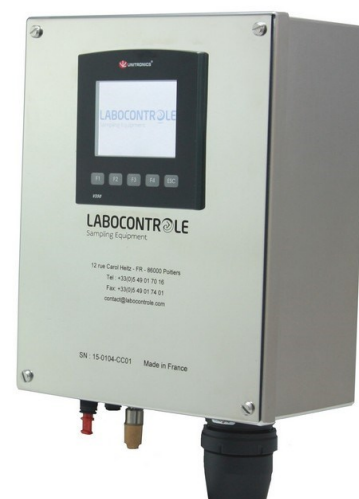
Coffret de commande à écran tactile

Lors d'une utilisation en mode manuel, l'opérateur peut piloter et contrôler complètement le processus de prélèvement de l'échantillon via l'écran tactile.